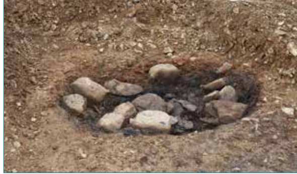
Foyer à pierres chauffées.

L'emprise de fouille est traversée par une dizaine de drains et de fossés parcellaires drainants au carrefour de plusieurs chemins se dirigeant vers le sud, le long d'un axe de circulation ancien vers le mont Devois. Toutes ces installations soignées présentent un conduit aménagé. Elles sont construites en plusieurs phases dont certaines remontent vraisemblablement à la période antique, et probablement en