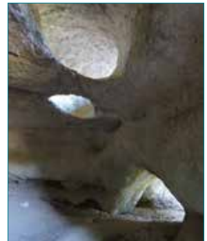
Clichés Audrey Saison