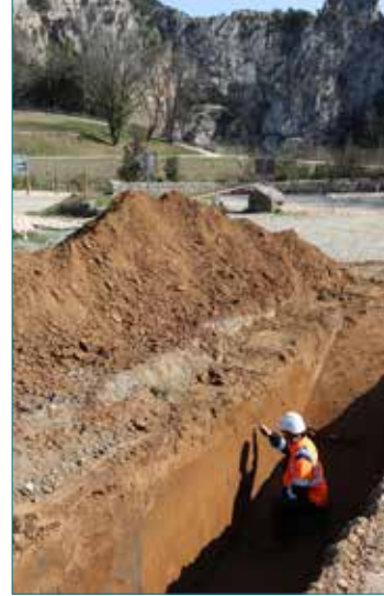
Diagnostic dans la Combe d'Arc à Vallon-Pont-d'Arc, mars 2022.

L'élargissement d'un passage bas dans la première partie de la grotte a donné lieu à la découverte d'outils attribués au Paléolithique moyen. Ceux-ci étaient associés à des restes osseux dominés par l'ours des cavernes, accompagné par d'autres carnivores (hyène, loup) et quelques herbivores. La découverte de ces outils très particuliers précise un peu plus notre connaissance de la fréquentation du milieu souterrain par Néandertal.