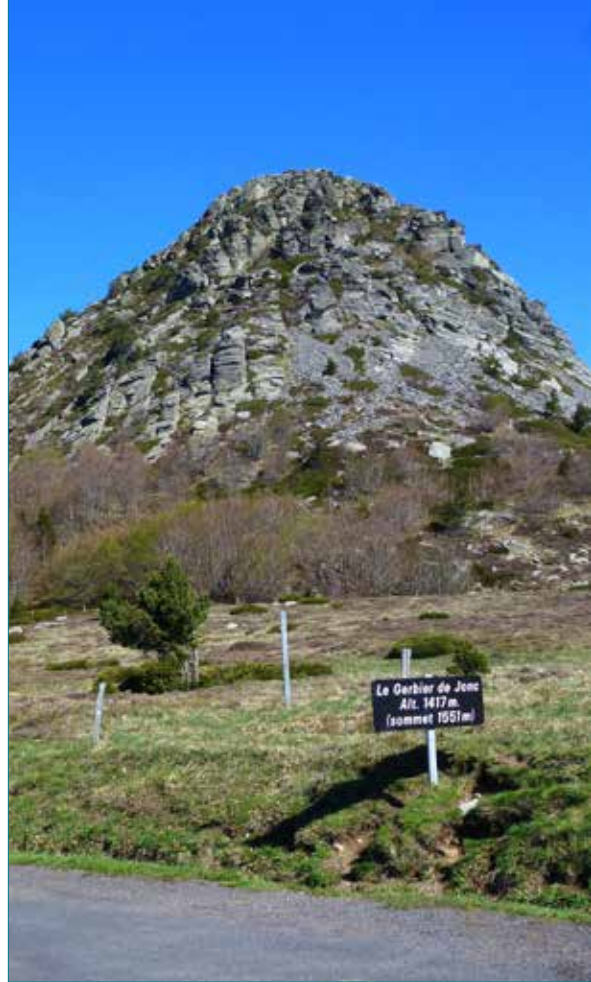
Mont Gerbier de Jonc.

Paléolithique moyen, Paléolithique supérieur, Épipaléolithique et Mésolithique sont principalement convoqués dans l'exposé qui reprend en les complétant des données micro-régionales éparses, des simples prospections aux complexes études de sites stratifiés, pour beaucoup connues.