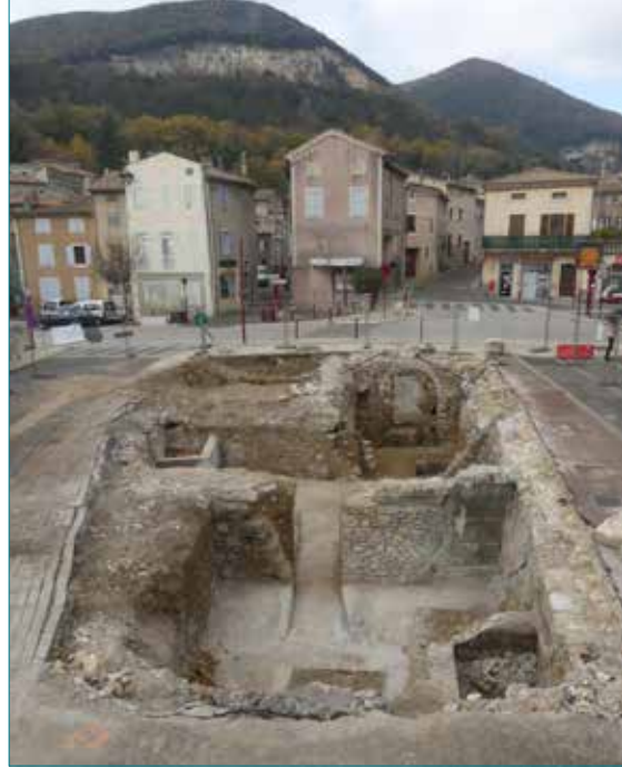
Vue générale de l'emprise de la fouille depuis l'est. Au Moyen Âge, on circulait 3 mètres plus bas que la route actuelle. Cliché : Guillaume Martin, Inrap

Les maisons du XIX e siècle sont fondées sur des blocs réemployés provenant du cloître. Cliché : Guillaume Martin, Inrap