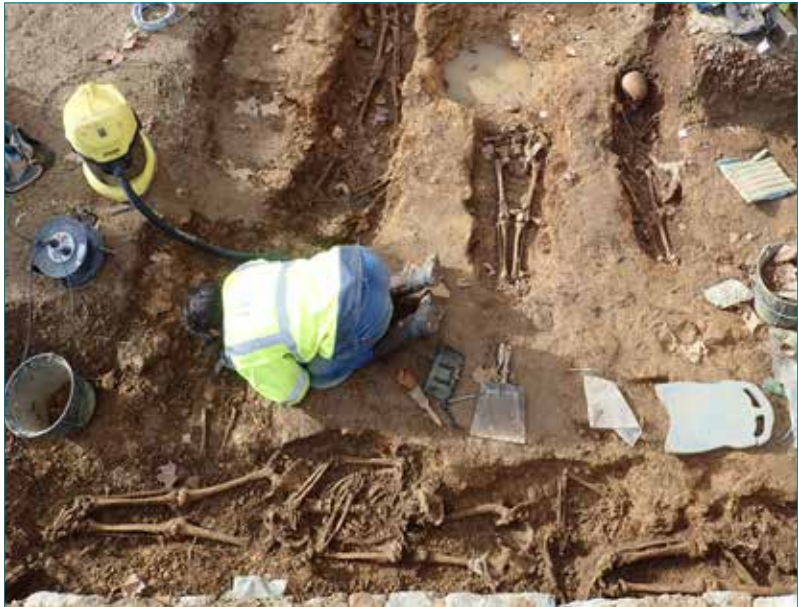
Fouille des sépultures de la place du Champ-de-Mars à Aubenas.

à l'établissement d'un profil biologique de chaque individu, elle permet à partir d'une population inhumée d'étudier la gestion de la mort et des morts par les populations passées. La fouille préventive de la