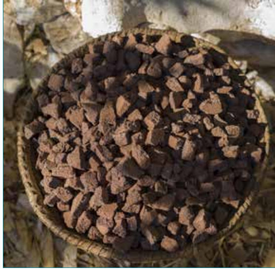
Minerai amalgamé.

Installée depuis 2013 à Saint-Alban-Auriolles dans le sud de l'Ardèche, l'équipe de l'archéosite de Randa Ardesca conduit de façon régulière des travaux d'archéologie expérimentale afin de comprendre et restituer au grand public les connaissances, les techniques et les gestes des artisans de plusieurs périodes chronologiques.