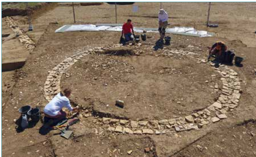
Fouille du mausolée antique à Alba-la-Romaine en 2020.

fouille réalisée dans ce secteur depuis 2013. Le site présente une occupation importante au cours de la Protohistoire. Un tronçon de circulation en chemin creux a été mis au jour ainsi que des fossés et des résidus d'installations de forge et